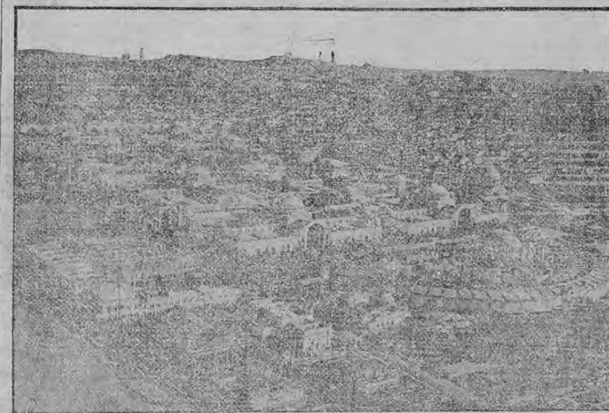
AERIAL VIEW OF PANAMA-PACIFIC EXPOSITION, SHOWING PART OF SAN FRANCISCO

Esta curiosa fotografía de la Exposición Panamá-Pacífico que se celebra en San Francisco, California, fué tomada desde un aeroplano. En ella se ven los muchos acres de espaciosas y hermosos edificios en que están colocadas las exhibiciones de cuarenta naciones. La Exposición, tal como se había dispuesto, se abrió el 20 de febrero corriente. La guerra europea no ha afectado en nada la Exposición, pues hasta las naciones beligerantes presentan sus exhibiciones, según se había proyectado.