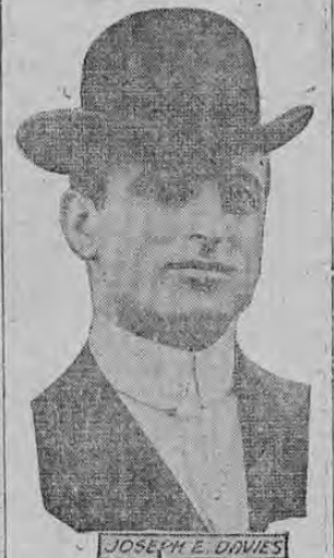
JOSEPH E. DAVIES

JOSEPH E. DAVIES TO BE HEAD OF THE NEW TRADE COMMISSION.